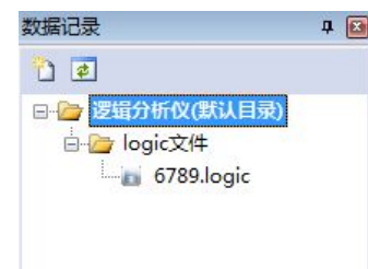
图 6.2 数据记录