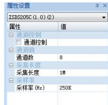
图 6.1 逻辑分析仪

点击右下角“数据记录”,出现如图 6.2 的界面。可以显示已经记录的文件。鼠标双击对应的文件,就可以将其载入,查看采集的数据。